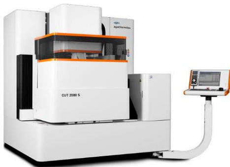
GF CUT 2000 S