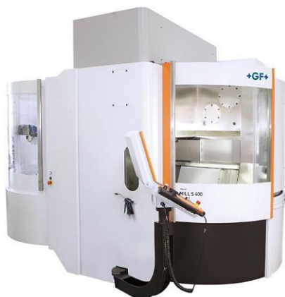
GF MIKRON Mill S 400 U