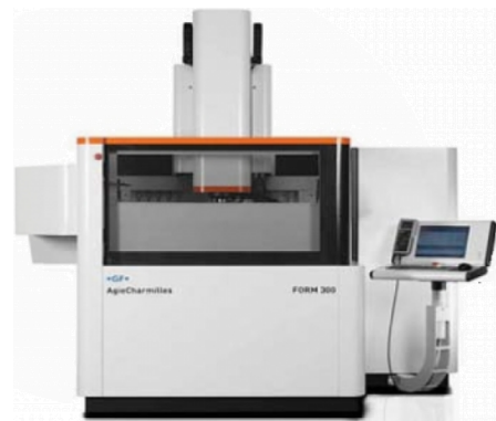
GF Form 300