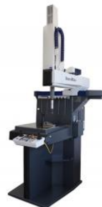
Zeiss Duramax 5